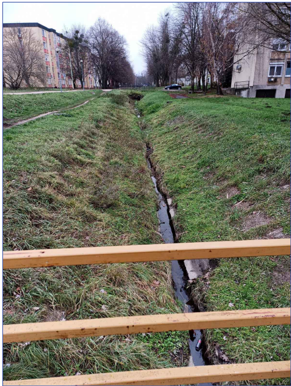
Jelenlegi állapot - torkolati híd